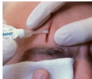
Präzision beim Wundverschluss