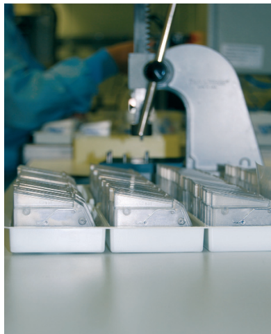
Produziert und gefertigt in Deutschland