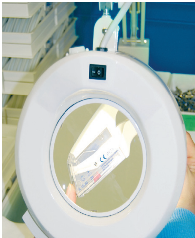
Optimale Qualitätskontrolle gemäß CE- Zertifizierung